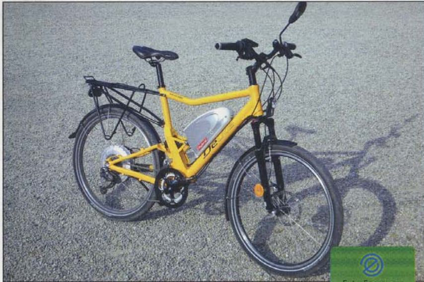
Bei dem getesteten Modell handelte es sich um ein Vorserienmodell.